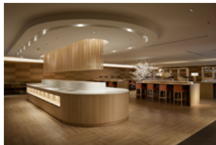
羽田空港 JAL 国際線サクララウンジ