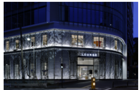
LOUNGE by Francfranc