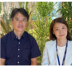
株式会社 乃村工芸社

浜松市、乃村工芸社による全国初のFSC®プロジェクト認証取得は、SDGsへの貢献について、第三者から評価された具体的な実績を示すことができるという点で、SDGs推進を目指す他の自治体の参考事例になると思います。このような事業展開を歓迎し、国内の認証取得活動が今後も拡大することに期待するとともに、私たちが普及啓発に努めていきます。 FSC®ジャパンウェブサイト