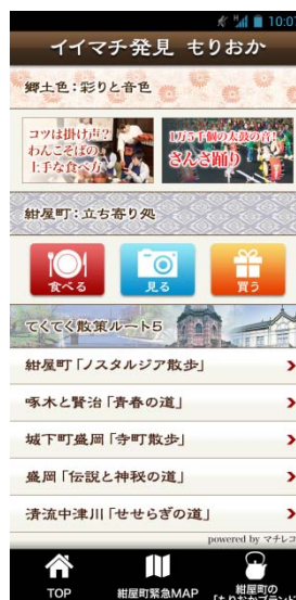
「マチレコトラベル」トップ画面