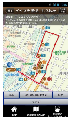
テーマに応じた ナビゲーションマップ