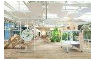
オープンスペース