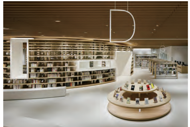
菊池市中央図書館