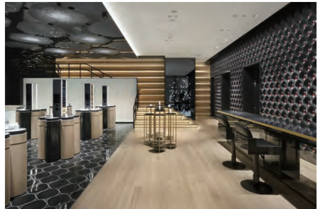
SHISEIDO THE STORE

http://www.sign.or.jp/wp/wp-content/uploads/2018/07/award2018b.pdf