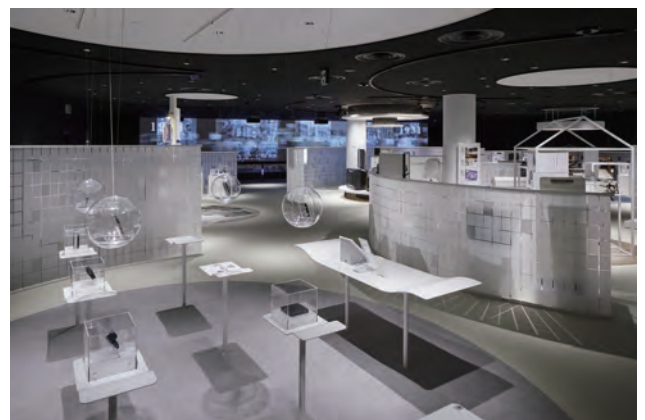
パナソニックミュージアム ものづくりリズム館