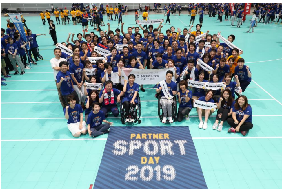
乃村工藝社チーム

参加者からは「親子で東京五輪音頭-2020-を踊ることができ楽しかった」「パートナー企業間で一体感が生まれる良いイベントだった」といった声が聞かれ、本イベントが、社員のスポーツ実施への関心度を高める機会にもなりました。