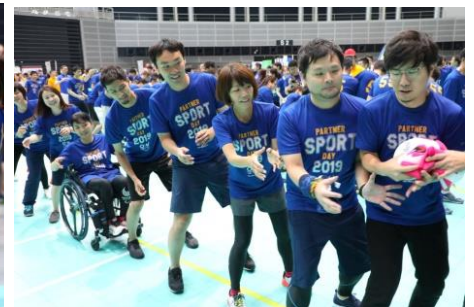
マスコット運びレースの様子