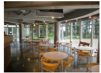
ミュージアムカフェ「Café Rokuto」店内

乃村工藝社が指定管理者として運営する多摩六都科学館(東京都西東京市)のプラネタリウム「サイエンスエッグ」が2012年7月7日にリニューアルオープンします。また、館内のカフェテリアとミュージアムショップも乃村工藝社グループのノムラデベロップメントの運営に生まれ変わります。